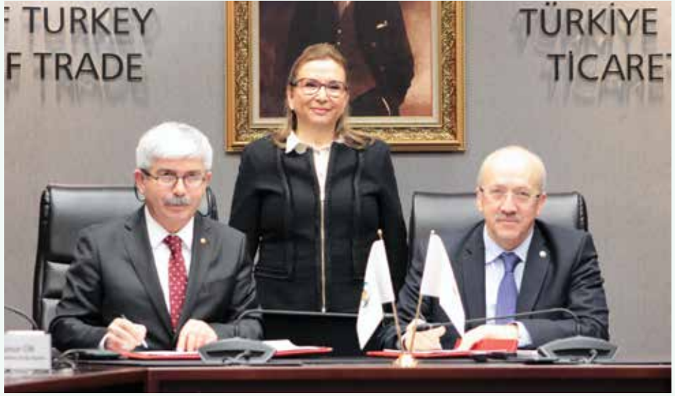
Türkiye Noterler Birliği’yle imzalanan taşıt alım satımına ilişkin ‘Güvenli Ödeme Sistemi 1 Şubat itibariyle hizmete alındı.

Bugüne kadar elden nakit ödeme, banka havalesi gibi uygulamalarla ödeme yapılıyordu. Artık taraflar isterse yeni sistemle ödeme yapma ve alma işlemini yapacak. Alıcı, ‘Güvenli Ödeme Sistemi’ne başvurusunu yapacak, miktarı belirleyecek ve belirlediği miktar alıcının hesabından, emanet hesaba bloke edilecek. 0 hesaptaki paraya, işlem bitinceye kadar kimse müdahale edemeyecek. Taraflar daha sonra noterliğe gelecek ve alım satım işlemi gerçekleşecek. İşlem bittikten sonra noter, aracı kuruluşa, ödeme yapan kuruluşa, işlemin bittiğini sistem üzerinden bilgilendirecek. Aracı kuruluş da o hesaptaki parayı, satıcının hesabına aktaracak. Sistem böyle işleyecek.