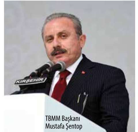
TBMM Başkanı Mustafa Şentop

K ırşehir'de düzenlenen etkinliklerle kutlanan Ahilik Haftası Kutlama programının 32. devlet töreni, Cacabey Meydanında Kırşehir Belediyesi Mehter Takımının gösterisinin ardından Kültür Bakanlığı Sanatçılarının şed kuşatıp bir geleneğin yaşamasını temsili olarak göstermesiyle başladı.