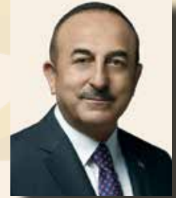
MEVLÜT ÇAVUŞOĞLU DIŞİŞLERİ BAKANI