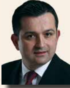
DR. BEKİR PAKDEMİRLİ TARIM VE ORMAN BAKANI