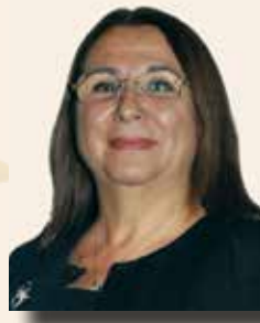
RUHSAR PEKCAN TİCARET BAKANI