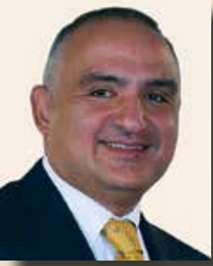
MEHMET ERSOY KÜLTÜR VE TURİZM BAKANI