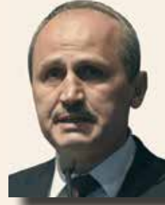
MEHMET CAHİT TURHAN ULAŞTIRMA VE ALTYAPI BAKANI