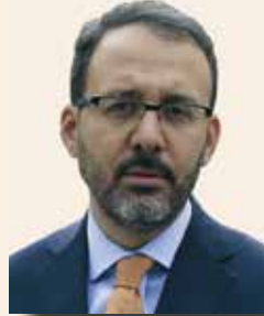
MEHMET KASAPOĞLU GENÇLİK VE SPOR BAKANI