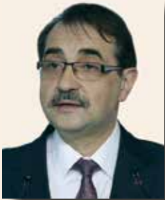
FATİH DÖNMEZ ENERJİ VE TABİİ KAYNAKLAR BAKANI