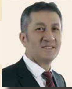
PROF. DR. ZİYA SELÇUK MİLLİ EĞİTİM BAKANI