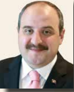
MUSTAFA VARANK SANAYİ VE TEKNOLOJİ BAKANI