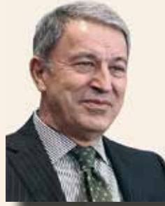
HULUSİ AKAR MİLLİ SAVUNMA BAKANI