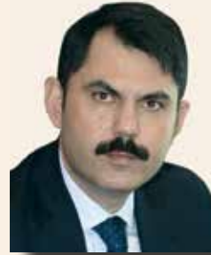
MURAT KURUM ÇEVRE VE ŞEHİRCİLİK BAKANI