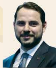
BERAT ALBAYRAK HAZİNE VE MALİYE BAKANI