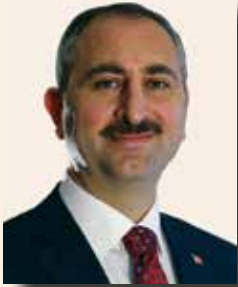
ABDULHAMİT GÜL ADALET BAKANI