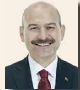
SÜLEYMAN SOYLU İÇİŞLERİ BAKANI