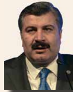
DR. FAHRETTİN KOCA SAĞLIK BAKANI