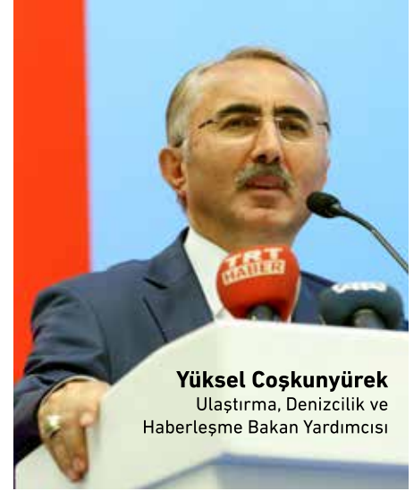
Yüksel Coşkunyürek Ulaştırma, Denizcilik ve Haberleşme Bakan Yardımcısı

Bu dönemde olduğu gibi yeni dönemde de sahte plaka basım ve satışını yapanlarla mücadelemiz devam edecektir.