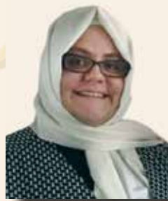
ZEHRA ZÜMRÜT SELÇUK ÇALIŞMA, SOSYAL VE HİZMETLER VE AİLE BAKANI