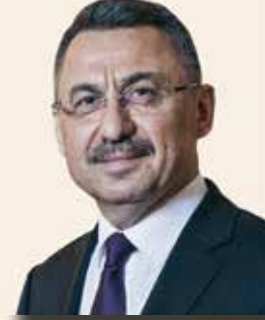
FUAT OKTAY CUMHURBAŞKANI YARDIMCISI