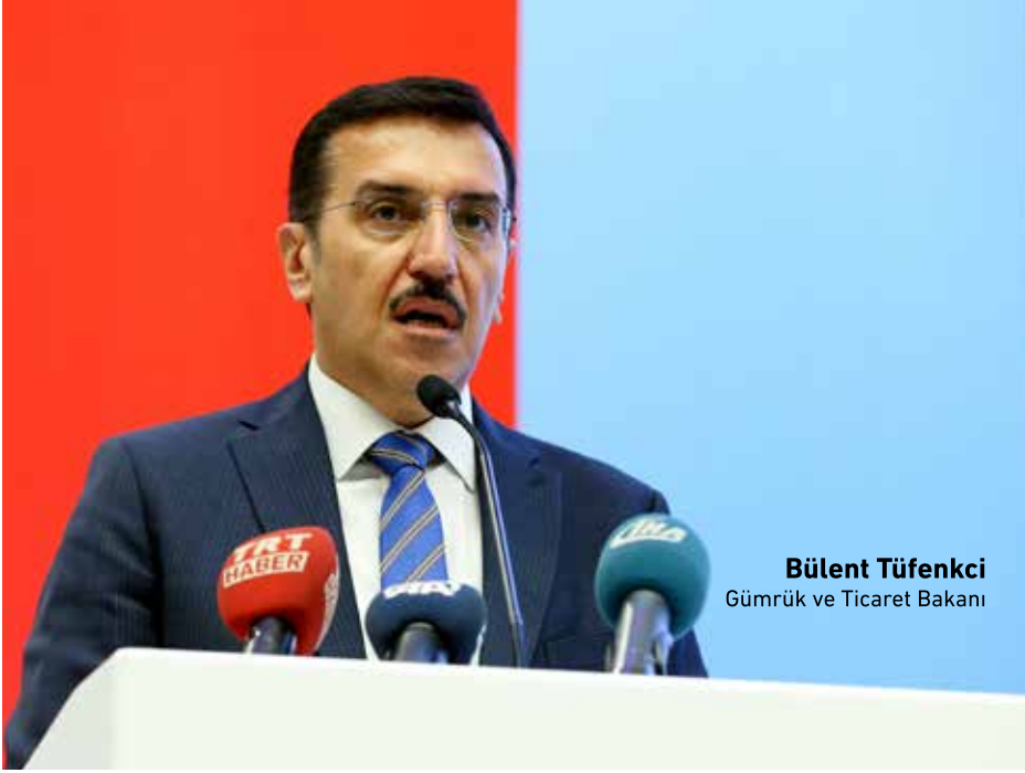
Bülent Tüfenkci Gümrük ve Ticaret Bakanı

Gümrük ve Ticaret Bakanı Bülent Tüfenkci, "Esnaf için Çiftçi Kart benzeri faizsiz bir desteği hayata geçirme noktasında çalışıyoruz"