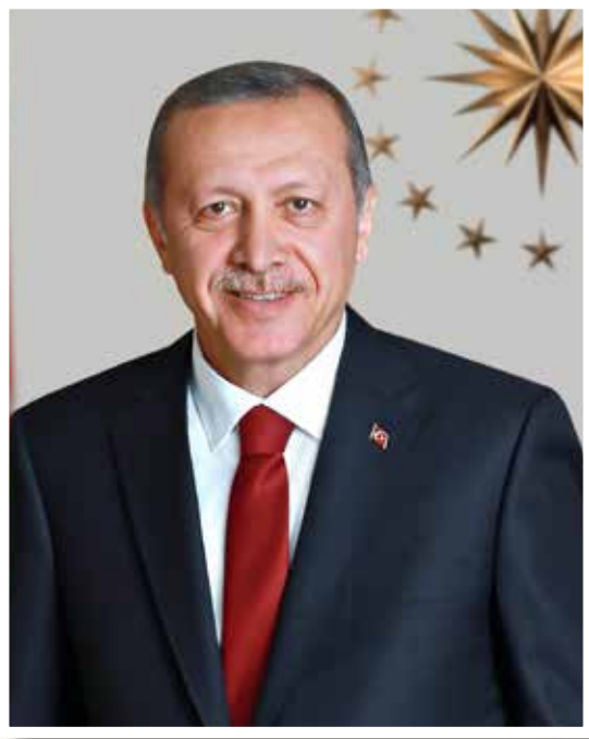
RECEP TAYYİP ERDOĞAN CUMHURBAŞKANI