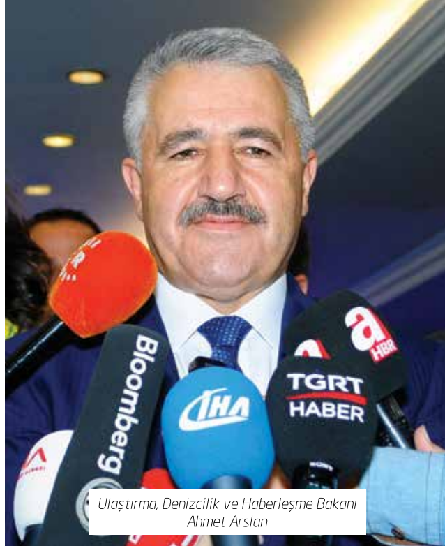
Ulaştırma, Denizcilik ve Haberleşme Bakanı Ahmet Arslan

Karayolu Taşıma Yönetmeliği Taslağı kapsamında hazırlıkları süren U-ETDS ile ilk defa Türkiye'de yolcu, kargo ve eşyaların hareketlerinin takibine ilişkin düzenleme hazırlandığını dile getiren Arslan, gerek sektör gerekse paydaşların görüşlerini