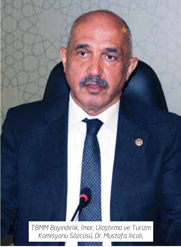
TBMM Bayındırlık, İmar, Ulaştırma ve Turizm Komisyonu Sözcüsü, Dr. Mustafa Ilıcalı,