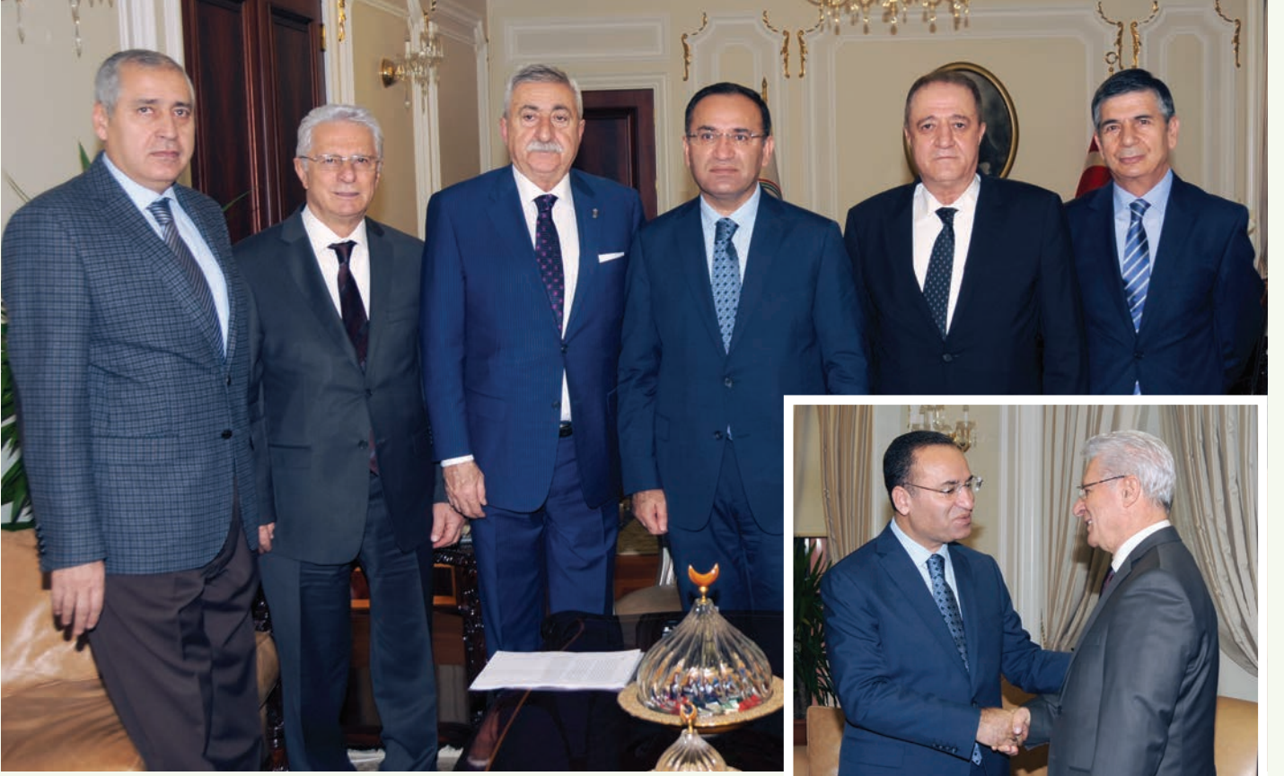
Adalet Bakanı Bekir Bozdağ ziyaretlerinden dolayı Türkiye Esnaf ve Sanatkarları Konfederasyonu Genel Başkan ve üyelerine teşekkür etti.