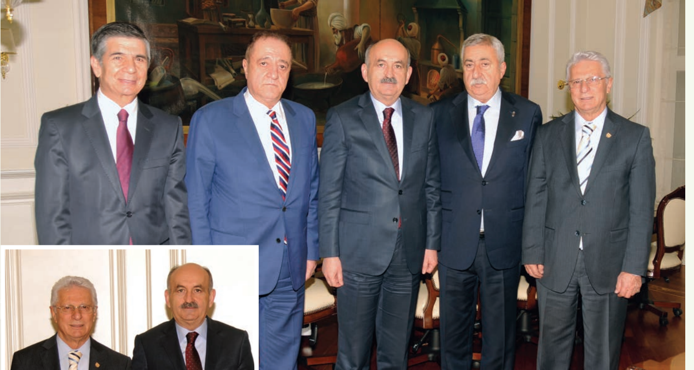
Sağlık Bakanı Mehmet Müezzinoğlu ziyaretlerinden dolayı Türkiye Esnaf ve Sanatkarları Konfederasyonu Genel Başkan ve üyelerine teşekkür etti.