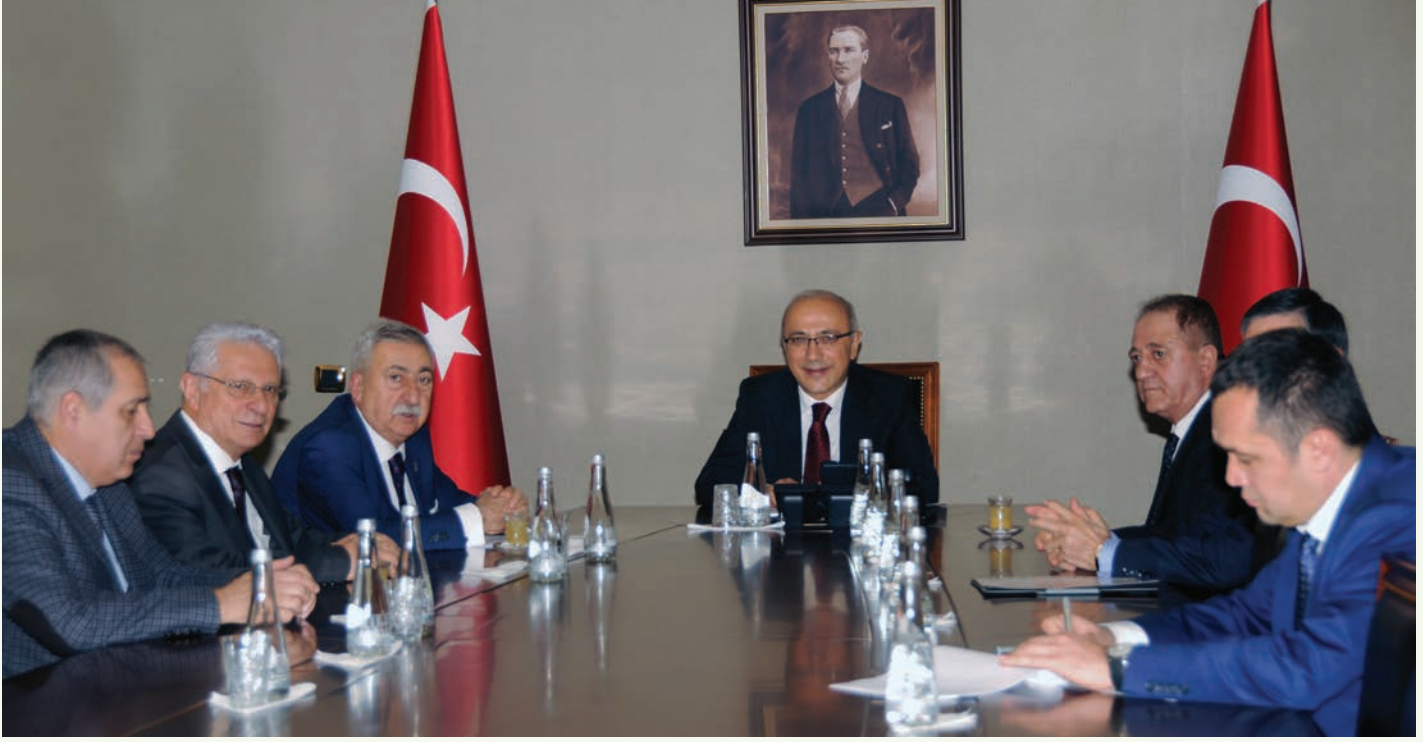
Başbakan Yardımcısı Lütfi Elvan ziyaretlerinden dolayı Türkiye Esnaf ve Sanatkarları Konfederasyonu Genel Başkan ve üyelerine teşekkür etti.