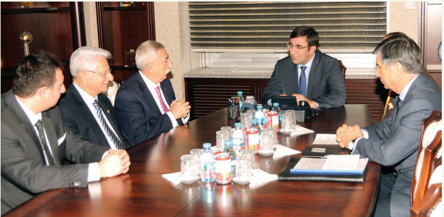
Kalkınma Bakanı Cevdet Yılmaz ziyaretlerinden dolayı Türkiye Esnaf ve Sanatkarları Konfederasyonu Genel Başkan ve üyelerine teşekkür etti.