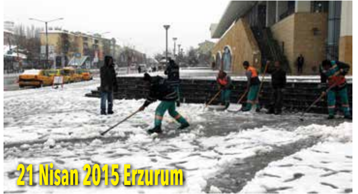
21 Nisan 2015 Erzurum

belirten Başkan Apaydın, "7 derecenin üzerinde sıcaklığı seyreden yerlerde yaz lastiklerini kullanalım. Çünkü 10 derece, 15 derece veya daha yüksek sıcaklıklarda kış lastikleri özelliğini kaybeder. Fren mesafesi uzar, yakıt sarfiyatı artar, bu yüzden kış lastiklerini çıkartılarak yaz lastiklerinin takılması gerekir" diye konuştu.