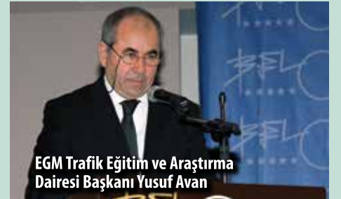
EGM Trafik Eğitim ve Araştırma Dairesi Başkanı Yusuf Avan

Emniyet Genel Müdürlüğü Trafik Eğitim ve Araştırma Dairesi Başkanı Yusuf Avan da konuşmasında; 2014 yılında meydana gelen ölümlü ve yaralamalı trafik kazalarında yaşamını yitirenlerin %9,3'ünün ve yaralananların %17'sinin 3-17 yaş arası çocuklarımız olduğunu belirtti. Ayrıca geçtiğimiz yıl okul servis araçlarının karıştığı 1.454 kazada 12 kişinin hayatını kaybettiğini ve 3.021 kişinin yaralandığını ifade etti. Trafik kazalarının önüne geçilebilmesi için denetimin yanında, eğitim, mü-