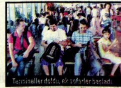
Terminaller doldu, ek seferler başladı.

Apaydın, "Bayramlarda araç yoğunluğu 10 katın üzerinde artıyor. Sürücüler trafiğin az olduğu saatlerde yola çıkmalı, yorgun ve uykusuz araç kullanmamalı, mola vermeli ve acele etmemelidirler. Emniyet kemeri kullanımı hayati öneme sahiptir. Çocuklarınızı da lütfen arkada oturtun" dedi.