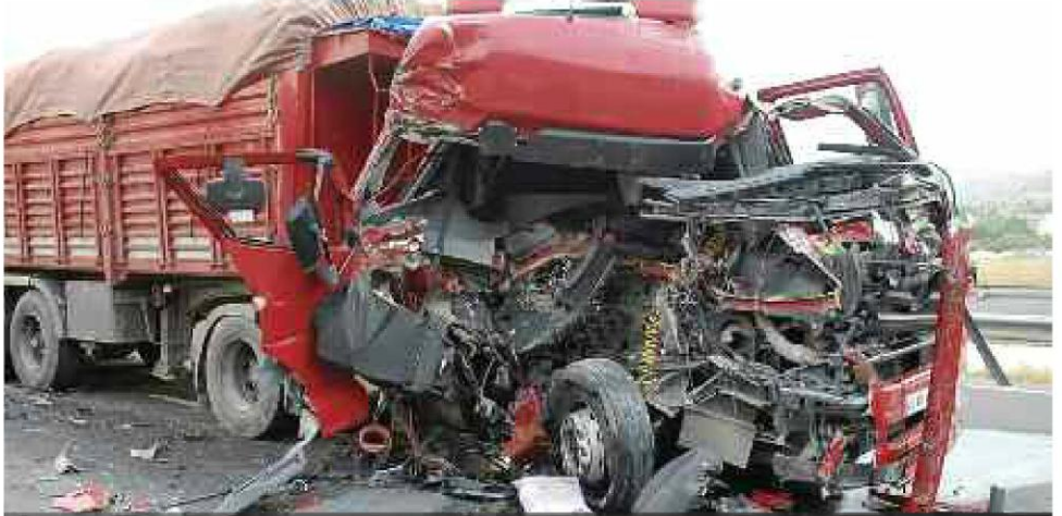
Trafik kazalarının ölümlü sonuçlanmasının en büyük nedeni emniyet kemerinin kullanılmaması. Sürücülerin araç uyarı sistemini susturmak için kullandıkları emniyet tokasını kullanana ceza verilirken, satana da ceza gündemde...