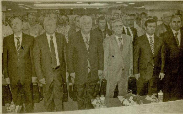
Emniyet Genel Müdürlüğü ile Türkiye Şoförler ve Otomobilciler Federasyonu'nun ortaklaşa düzenlediği "Ticari Araç Sürücülerini Bilgilendirme Toplantısı", İzmir Şoförler ve Otomobilciler Esnaf Odası ev sahipliğinde Esnaf ve Sanatkarlar Odaları Birliği'nde gerçekleştirildi.